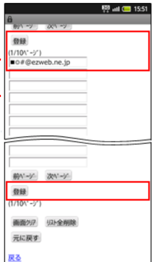
受信したいアドレスを入力して「登録」を選択

SmartCatシステムのEメールを受信するため下記ドメイン・メールアドレス3種類を指定受信リストに設定してください。